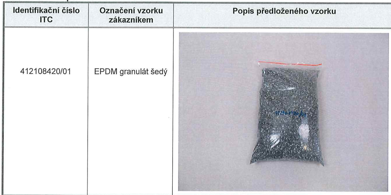
Tabulka č. I – Popis a identifikace vzorků